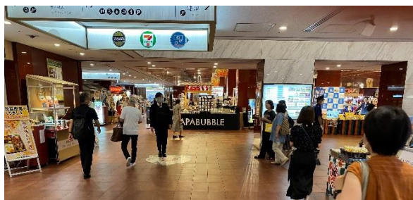
写真 B（左折するとこのように見えます）