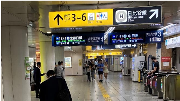
写真 A（改札口を出た所の写真です）

(1) 都営浅草線（日本橋から東銀座方面の利用者の方） 「東銀座」で下車してください。